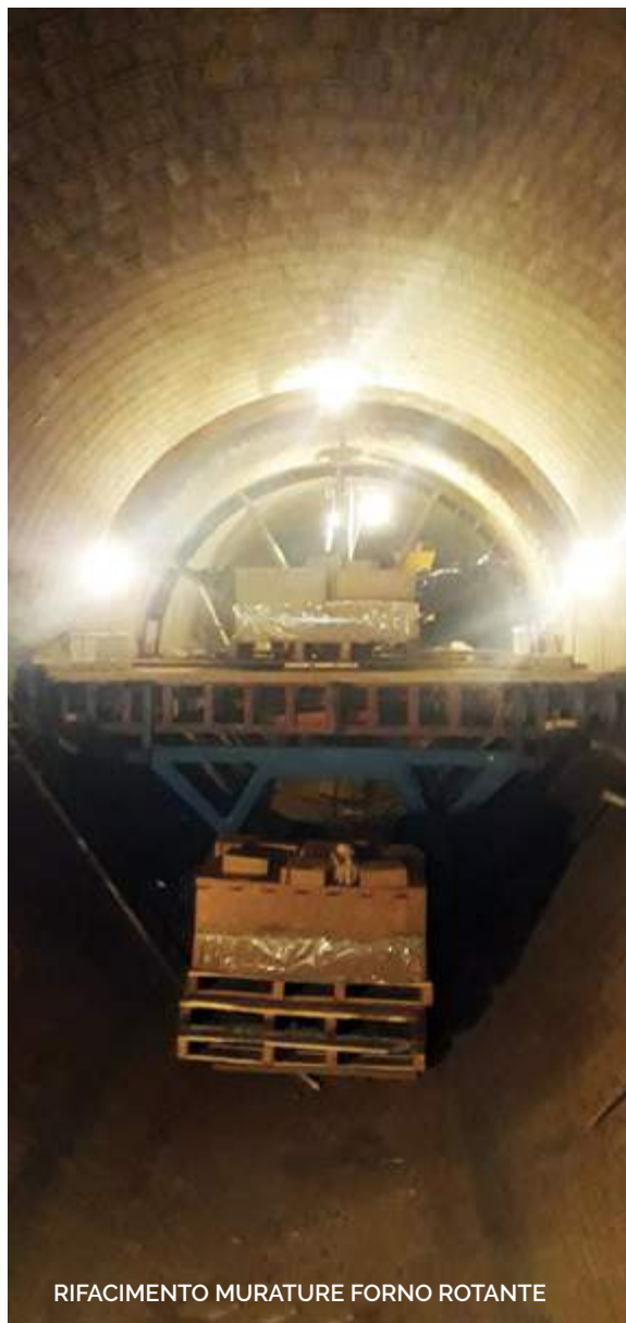
RIFACIMENTO MURATURE FORNO ROTANTE