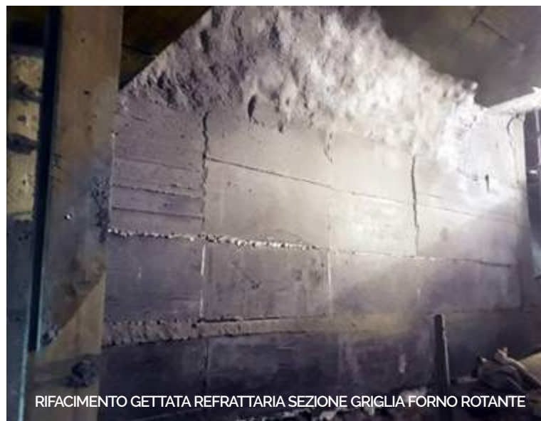
RIFACIMENTO GETTATA REFRATTARIA SEZIONE GRIGLIA FORNO ROTANTE