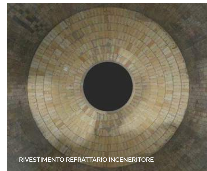
RIVESTIMENTO REFRAATTARIO INCENERITORE