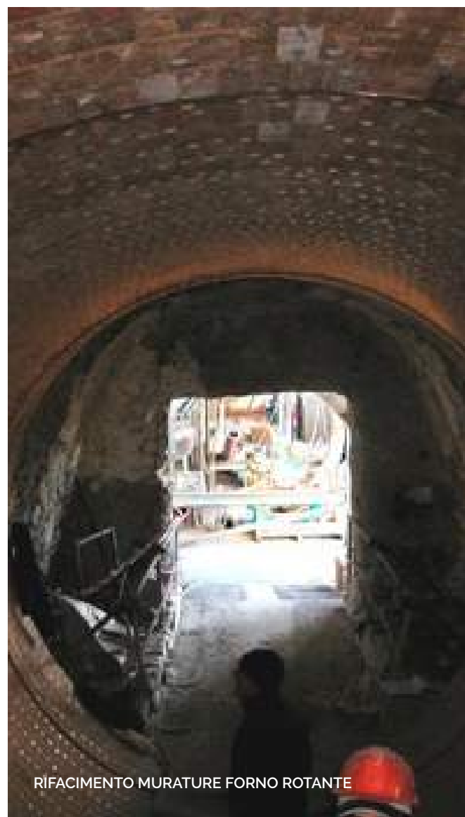
RIFACIMENTO MURATURE FORNO ROTANTE