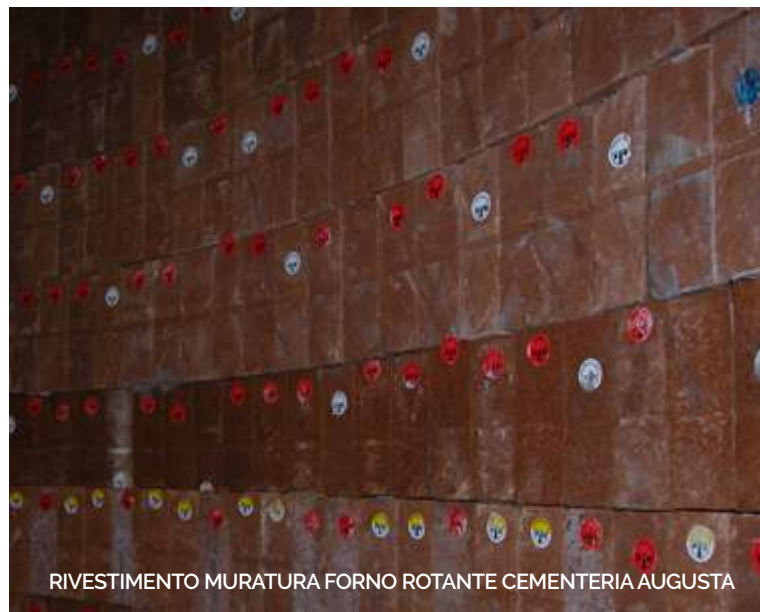
RIVESTIMENTO MURATURA FORNO ROTANTE CEMENTERIA AUGUSTA