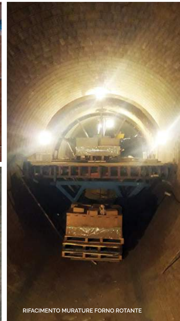
RIFACIMENTO MURATURE FORNO ROTANTE