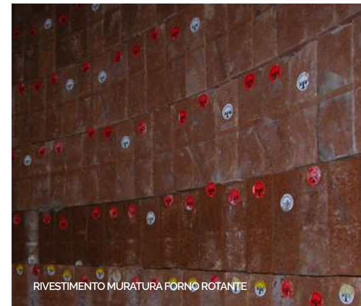
RIVESTIMENTO MURATURA FORNO ROTANTE