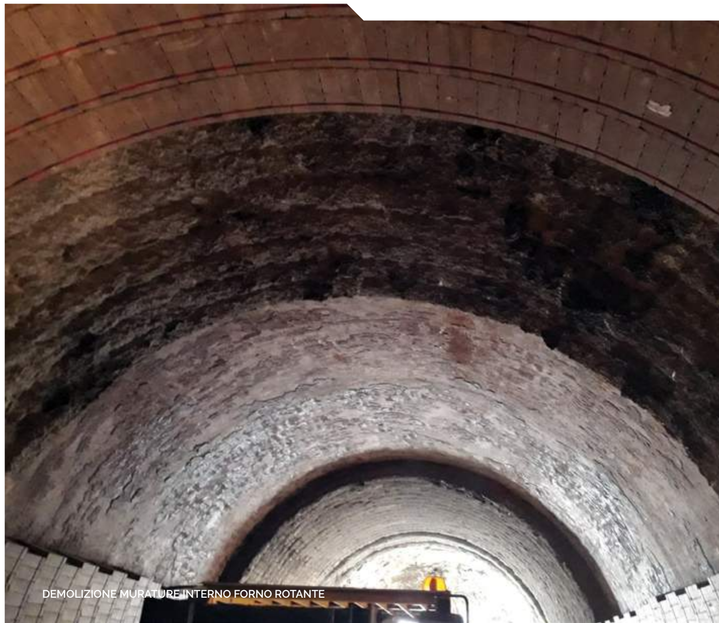
DEMOLIZIONE MURATURE INTERNO FORNO ROTANTE