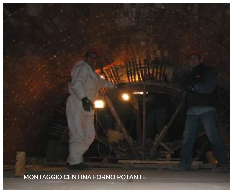
MONTAGGIO CENTINA FORNO ROTANTE